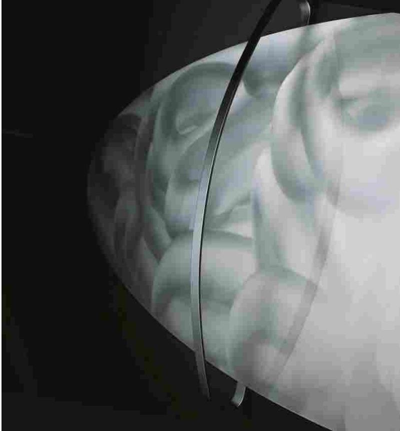
Forme, finiture e colori personalizzati con Ridea