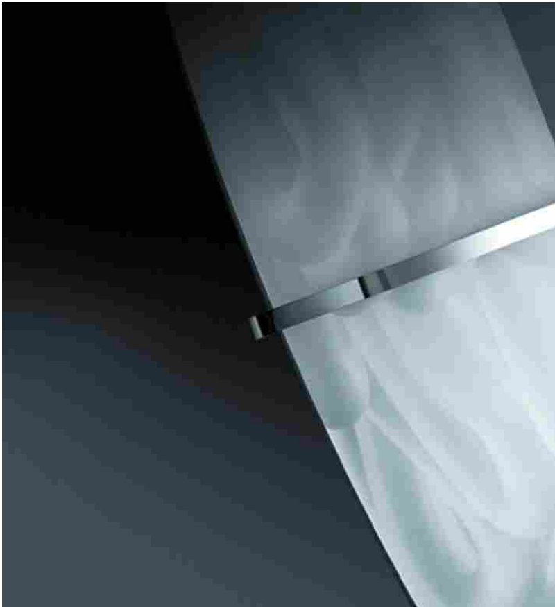
Forme, finiture e colori personalizzati con Ridea