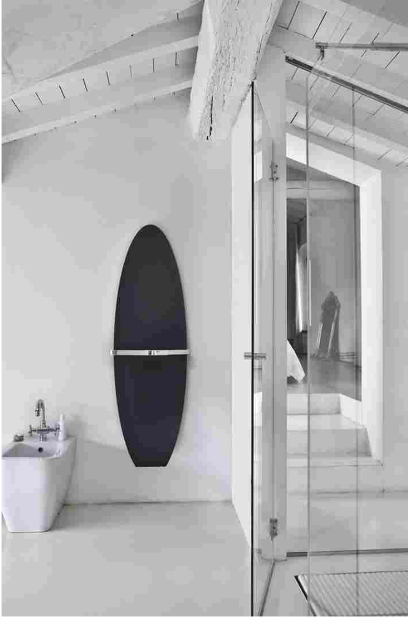
Forme, finiture e colori personalizzati con Ridea